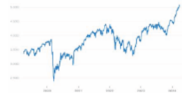
Euro Stoxx 50